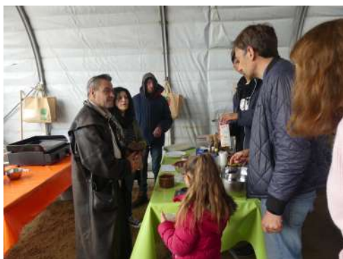
Ateliers autour du goût dans le jardin d'insertion « Jardins du Girou » du Réseau Cocagne

Du cœur de la ville de Toulouse jusqu'aux coteaux du Girou, le grand public a eu l'occasion de visiter des fermes agroécologiques et solidaires.