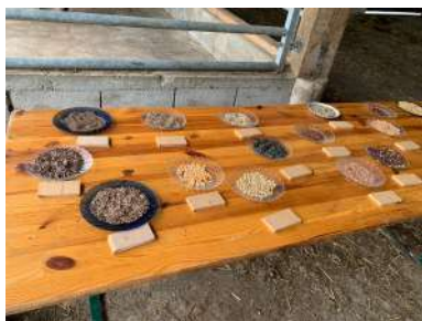
Jeu de reconnaissance de graines à la ferme « La Viande d'Olivier » à Saverdun

Nouveau circuit cette année, les visiteurs ont pu découvrir des productions diversifiées et des acteurs de l'agriculture biologique dans le bassin Auterivain et aux portes de l'Ariège. Entre élevage bovin, jardin d'insertion, vignoble, et serre à plants, il y en avait pour tous les goûts !