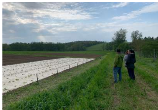
Visite des jardins de "A la bonne ferme" dans l'enceinte de l'abbaye de Bellegrade-Sainte-Marie

Les visiteurs ont ensuite pu se régaler de quelques galettes de sarrasin et de bière au miel à l'Oasis des abeilles ou encore d'un maïsotto de maïs rouge d'Astarac à la Ferme d'En Jouantet !