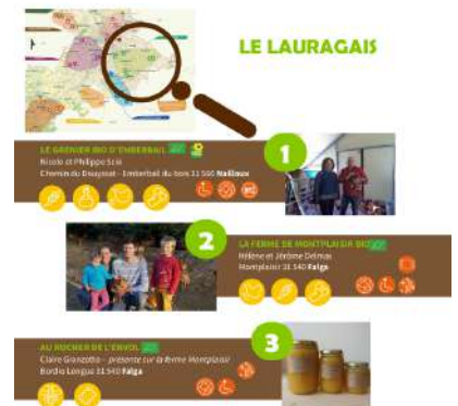
"Zoom sur un circuit [...]": promotion de l'opération sur les réseaux sociaux

Nous avons pu promouvoir l'opération lors d'une conférence de presse à la Fermaquatic de Belberaud autour d'un buffet offert bio & local avec les produits des fermes participantes.