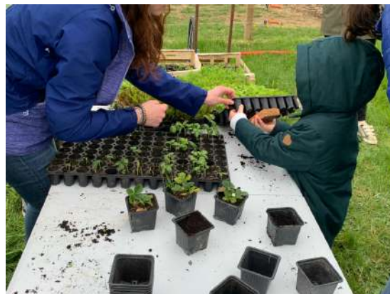
Confection de plants avec des familles participantes au défi « Familles à Alimentation Positive » de Toulouse Métropole

Un quizz de 10 questions (2 par ferme) a été proposé dans le circuit avec 5 lots à gagner. Les gagnants ont été tirés au sort parmi les quizz avec les bonnes réponses !