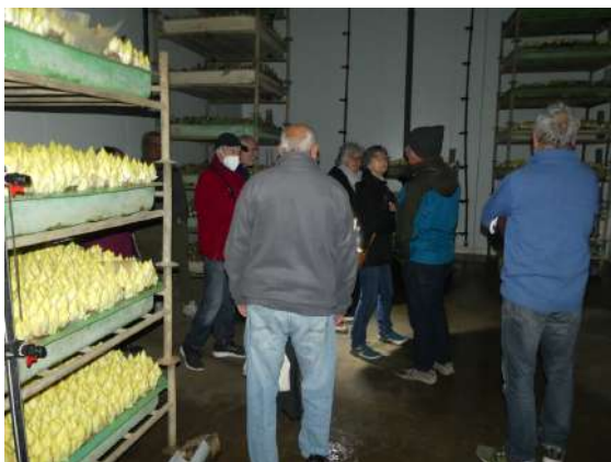
Visite de l'endiverie à la ferme Terre de vies à Saint-Léon